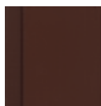
7817 Čokoládově hnědá krycí RAL 8017