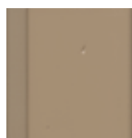
7119 Šedobéžová krycí RAL 1019