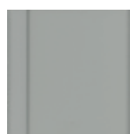
7542 Dopravní šedá A krycí RAL 7042