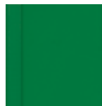
7629 Mátově zelená krycí RAL 6029