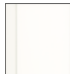
7262 Čistá bílá krycí RAL 9010