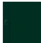
7283 Jedlově zelená krycí RAL 6009