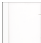
7500 Dopravní bílá krycí RAL 9016