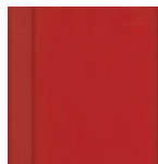
7530 Ohnivě červená krycí RAL 3000