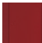
7511 Hnědočervená krycí RAL 3011