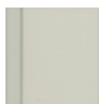
7738 Achátově šedá krycí RAL 7038